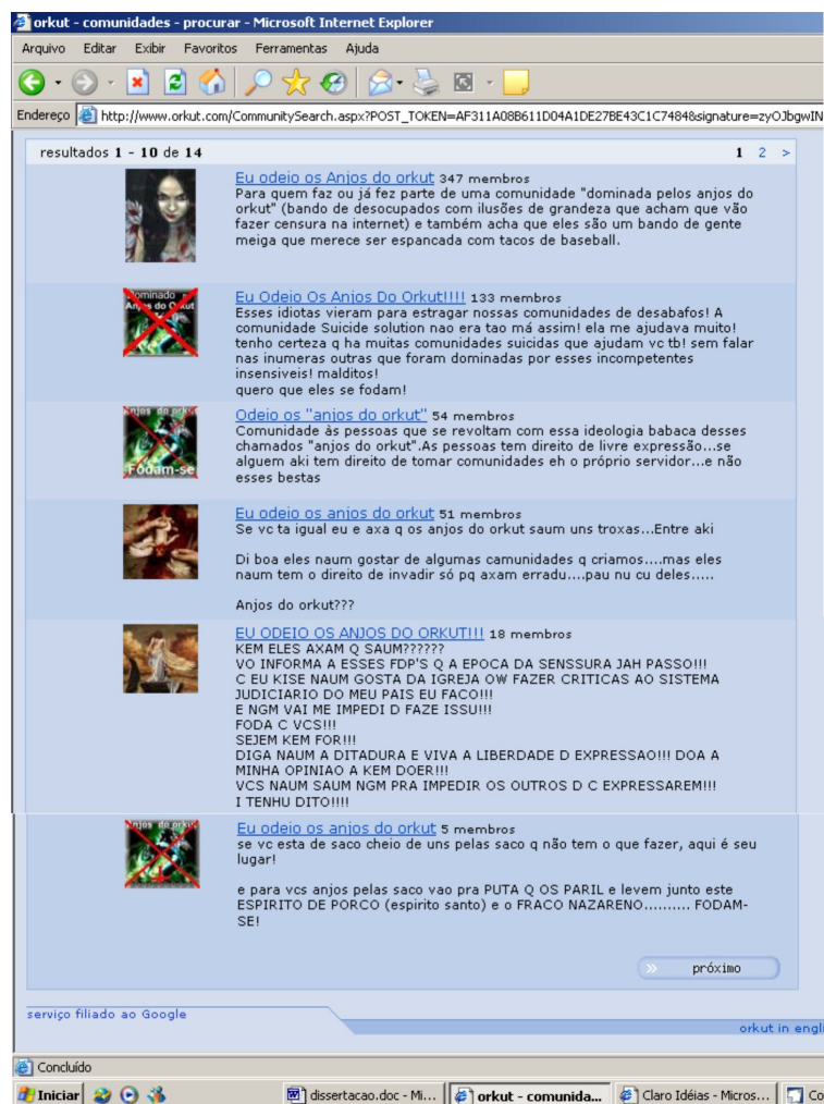
FIGURA 2 – Comunidades contra os Anjos do Orkut

Em oposição a esses grupos moralizadores existem várias comunidades (FIGURA 2) de oposição a este movimento. Essas comunidades consideram que os Anjos do Orkut estão “violando os direitos de liberdade de expressão” e em muitas situações debocham afirmando que são uns “idiotas que se acham que vão fazer censura na internet” 17 . Esta postura, na verdade, acaba por apoiar indiretamente a violência, o crime e a contravenção e não parece estar relacionada com a liberdade de expressão e sim com a glamorização da transgressão (outra expressão relacionada a comportamentos da pós-modernidade, principalmente entre os jovens), visto que as comunidades invadidas e dominadas realmente abordavam temas proibidos ou comportamentos ilegais ou não aceitos eticamente (pornografia, discriminação étnica e racial, apologia ao nazismo, incentivo ao crime e à violência). Estas oposições podem