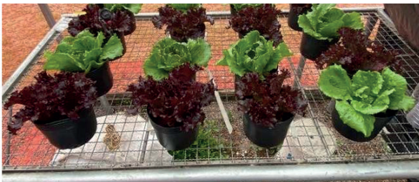
Tratamento Led crespa e americana 38 DAT