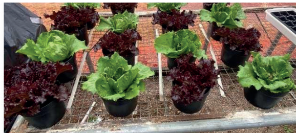
Tratamento Controle crespa e americana 38 DAT

Ainda assim o tratamento se demonstrou com potencial tanto para o desenvolvimento de futuros experimentos explorando a relação de distância ou horas entre os painéis e vasos (ou bancadas, em casos de hidroponia) em um sistema que visa suplementar a entrada de energia luminosa no sistema.