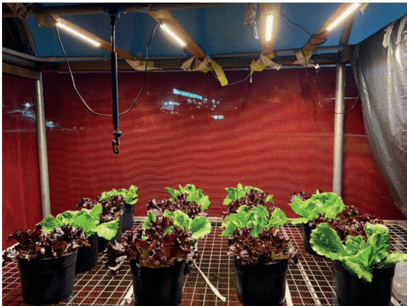
Figura 2. Montagem dos tratamento led aos 38 dias na casa de vegetação.

b) Métodos: O experimento foi montado em duas bancadas de 1,89x1,04 com duas cultivares de alface (americana e crespa roxa). O LED utilizado é do tipo grow, específico para crescimento de plantas com a luz “branca quente”, que simula todas as ondas do sol. Cada painel é constituído de 30 emissores, sendo que 5 deles são do espectro vermelho (620-675nm), o qual estimula o crescimento vegetativo da planta, composição 25:5 WR. O LED foi acionado durante 4 horas diárias, das 17:30 as 21:30. O crescimento das plantas e seus aspectos foram avaliados a cada 7