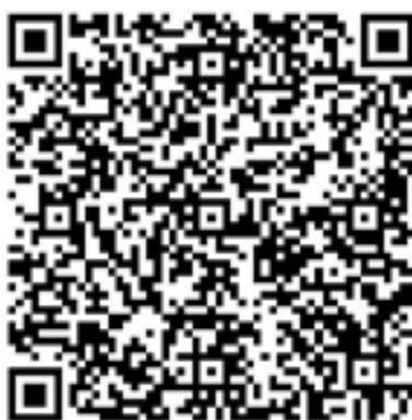
Figura 01 - QR Code do banco dos dados arquivados

Para a coleta de dados, foi escolhido o canal do youtuber Felipe Neto. Os dados coletados foram classificados como arquivados. Os dados arquivados, de acordo com Kozinets (2014), são dados que o pesquisador copia diretamente de comunicações mediadas pela internet. São dados preexistentes dos membros de uma comunidade online, cuja criação ou estimulação o pesquisador não está diretamente envolvido. Foi criado um QR Code para acesso ao banco de dados 4 arquivados como ilustramos na Figura 1. Dessa forma, o banco de dados ficou disponível para todos os leitores que tenham interesse. No banco de dados constam todos os prints obtidos da página do youtuber Felipe Neto bem como as transcrições realizadas. A coleta de dados começou no início do ano de 2020 e se encerrou no começo do ano de 2022.