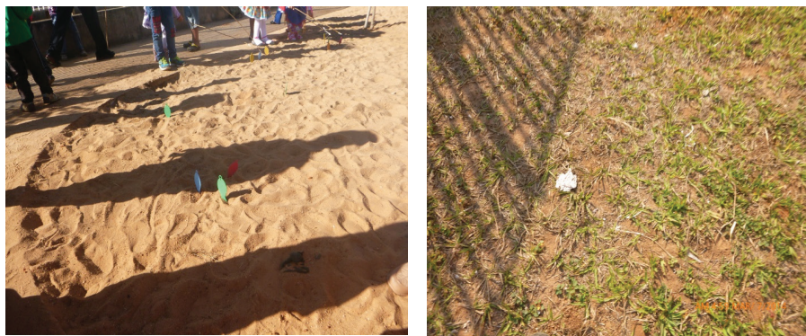
Figura 2: CRIANÇAS, 2014, P1010462, P10300881).

Neste arriscar percorrer um percurso pelas nuances da pesquisa, nos deparamos com a imposição de um não-saber que é experiência, puro desejo, doce saborear, proliferação de ideias e pensamentos acerca de imagens-sensações, imagens-tempo, imagens-cortes, imagens-borrões, imagens-foco, imagens e mais imagens que pouco tem a nos dizer.