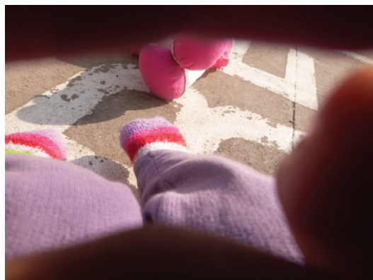
Figura 3: CRIANÇAS, 2014, P1010630.

Essa ideia nos ajuda a crer que mesmo quando acreditamos que tudo já foi dito, estabelecido, definido, pensado, pela abertura da infância, da experiência e da linguagem, muito ainda permanece por ser dito, estabelecido, definido, pensado. Assim, a linguagem e suas linhas de abertura e montagem nos fazem sempre nos apresentar como se fôssemos crianças diante do mundo, e nos colocam sempre a necessidade de uma abertura para o que ainda não é, e também nem foi (LEITE, 2011, p.180).