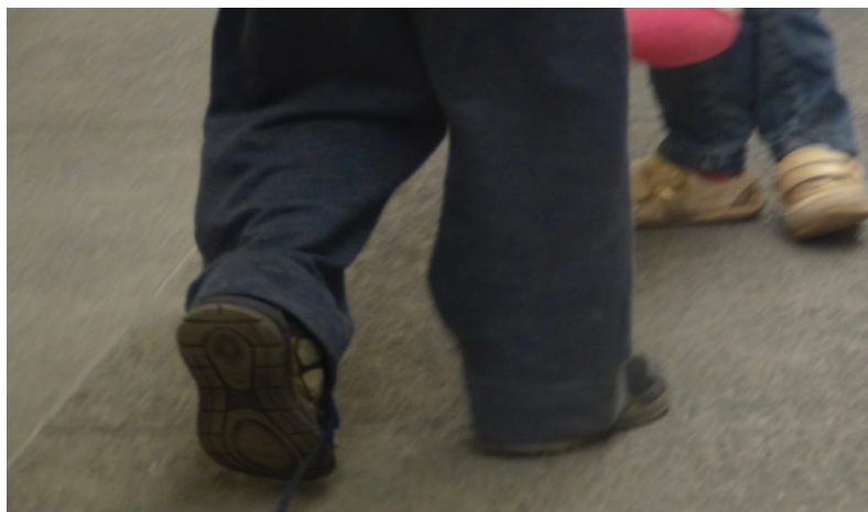
Figura 1: CRIANÇAS, 2014, DSC 000077.

Masschelein (2008) ao propor uma educação do olhar já indicava o caminhar com uma única certeza: a falta de certeza.